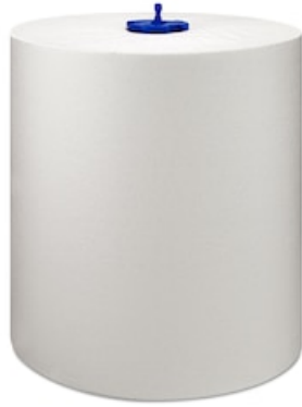
Tork Matic langes Rollenhandtuch Uni H1 290059