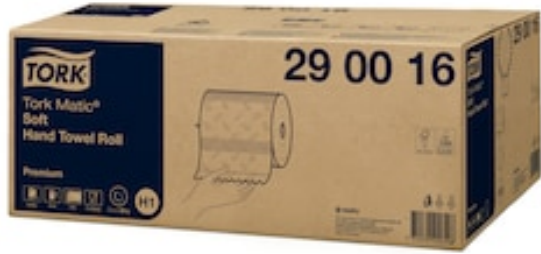
Tork Matic weiches Rollenhandtuch PremH1 290016