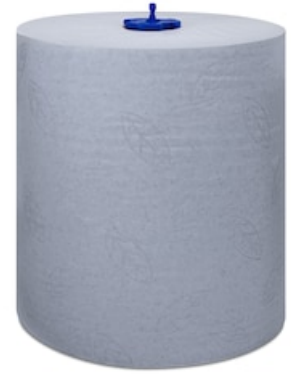
Tork Matic blaues Rollenhandtuch Adv H1 290068