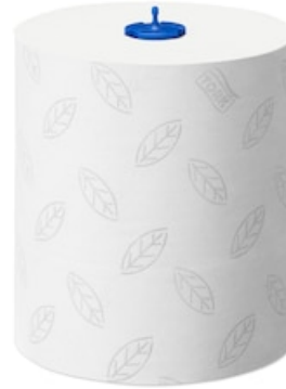
Tork Adv. Rollenhandt. Weich 2lg150m 290067