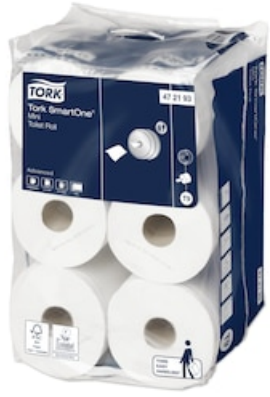
Tork SmartOne® Mini Toipa Adv 2lg T9 472193