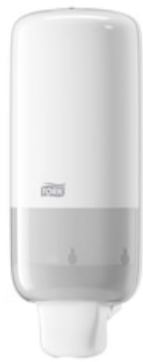
Tork Spender Schaumseife Elev weiß S4 561500