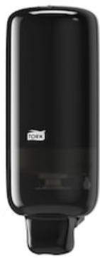
Tork Spender Schaumseife Elev schw S4 561508