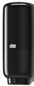
Tork Soap-Sanit Disp – Int Sens, bl 561608