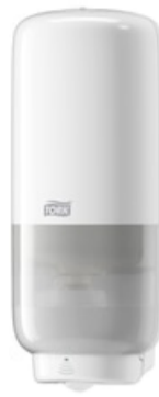
Tork Soap-Sanit Disp – Int Sens, wh 561600